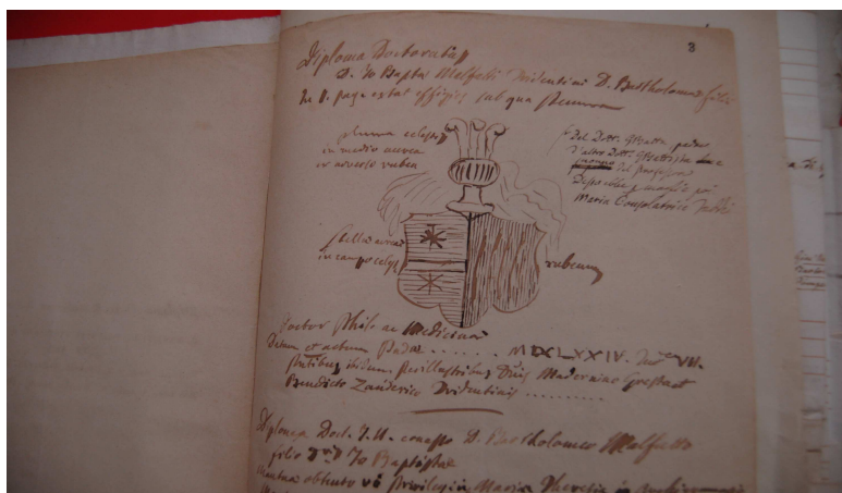
Esempio di manoscritto delle sezioni di conservazione della biblioteca

Inoltre dal 2016 la Biblioteca comunale di Ala ha aderito ad alcuni progetti di digitalizzazione in collaborazione con l'Ufficio per il Sistema bibliotecario trentino, con la Soprintendenza per i Beni Culturali PAT, la Biblioteca FBK e la Biblioteca comunale di Trento (fra i quali l' Archivio dei possessori e il progetto Del Concilio ). Dal 2020 la Biblioteca ha aderito al progetto "eCultura" dell'Università di Trento tramite il quale sono in corso di valorizzazione alcune figure in particolare (ad esempio il matematico Gianfrancesco Malfatti, il musicista Giacomo Sartori e altri).